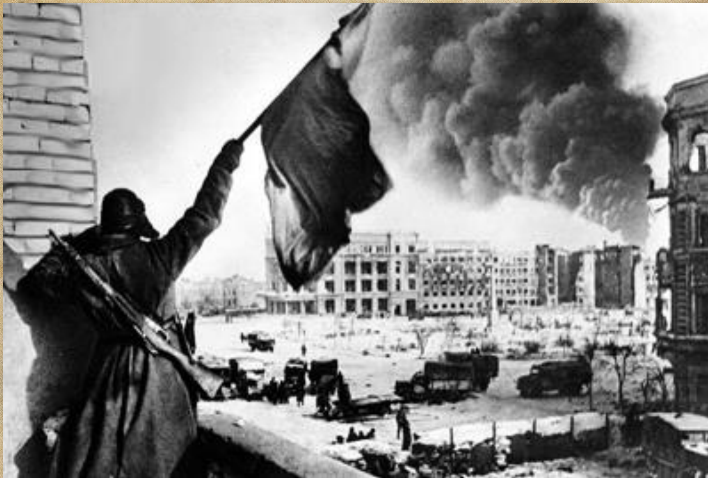
На фото: Флаг над освобождённым городом, Сталинград, 1943 год.