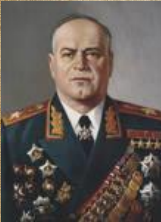
Г. К. Жуков