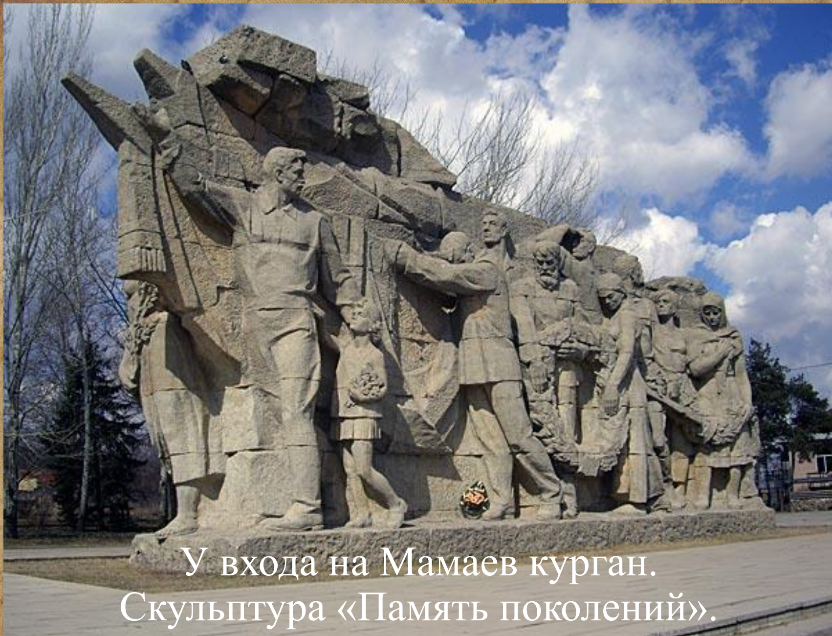
У входа на Мамаев курган. Скульптура «Память поколений».